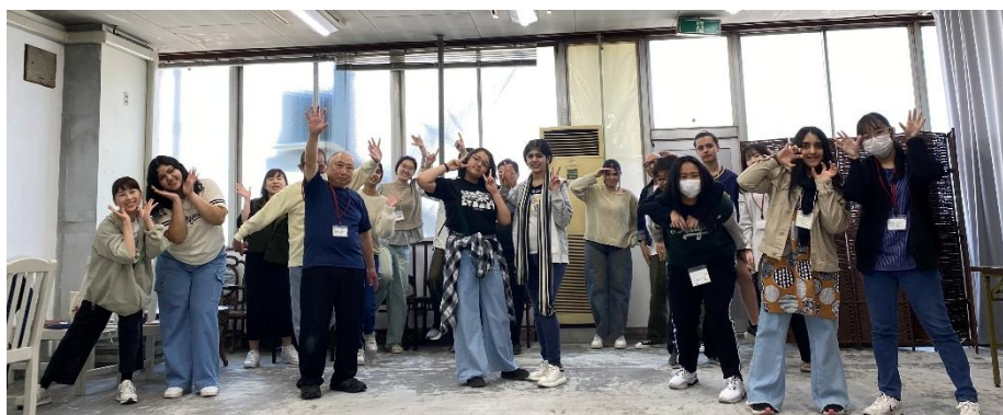
4月26日ダンスワークショップ