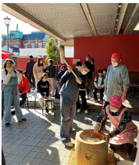
12月6日「日本の餅文化を知ろう！」CEP講座