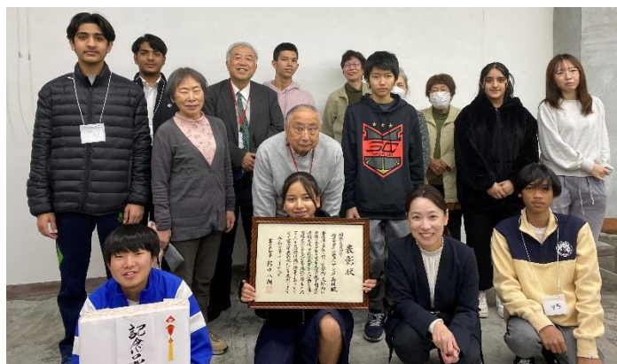
令和7年度富山県国際交流部門功労表彰受彰