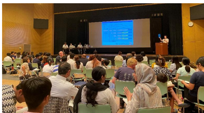
高校進学ガイダンス (9月28日水橋ふるさと会館ホール)