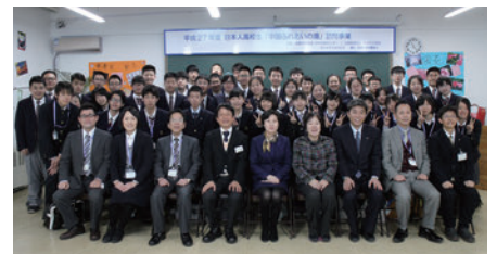
長春日章学園訪問