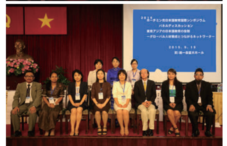
日本語教育シンポジウム