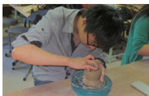
2013年夏の研修交流会での陶芸体験

私がこれから中国に戻って、大学の講師として就職することが決まったら、このかめり財団の皆様の優しさ、そして平和を愛する日本人の優しさを、ちゃんと自分の未来の学生達に伝えよう思っております。自分はこのかめりファミリーの絆を抱いて、これからもかめり財団の奨学生として、名に恥じないよう頑張っていきたいと思えます。