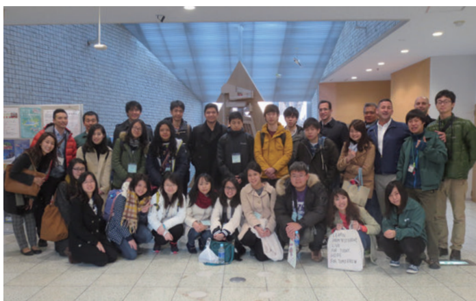
かめのり地球青少年サミット 2016 [KEYS2016]