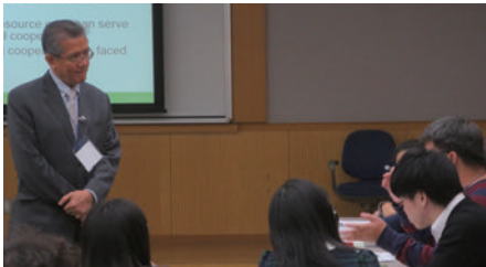
トゥーラオ教授の講義