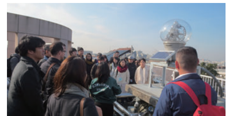
エコポリスセンター視察