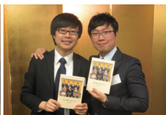
修了生には記念のアルバムを贈呈